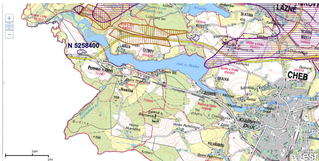
Obr. 1. Mapa ložiskové ochrany v katastrálním území Pomezí nad Ohří (podklad SurIS ČGS, 2015).

Pomezí-Ratshan (Obr. 1). Nachází se zde pozůstatky po bývalé těžbě hnědého uhlí a pyritu , které jsou registrované v evidenci poddolovaných území v archivu ČGS pod názvem Pomezí nad Ohří (ID 7; Obr. 2).